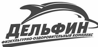
ГРАФИК РАБОТЫ В ДНИ МАЙСКИХ ПРАЗДНИКОВ Выходные дни 30 апреля – 1 мая 8 – 9 мая

391160, Российская Федерация, Рязанская область, Пронский район, г.Новомичуринск, ул.Строителей, д.14